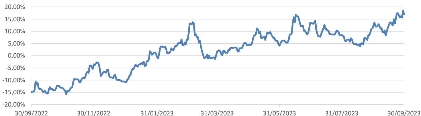
GRÁFICO EVOLUCIÓN VALOR LIQUIDATIVO DE MG LIERDE FONDO DE PENSIONES