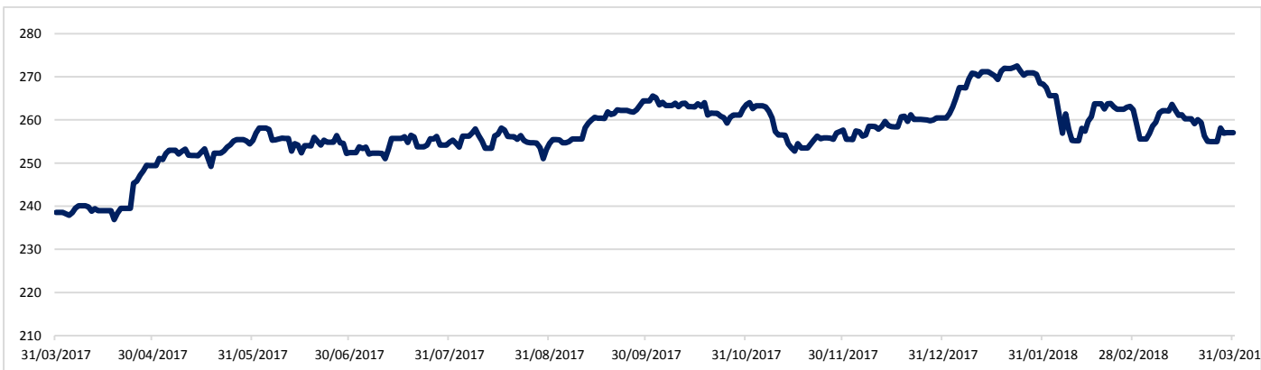
GRÁFICO EVOLUCIÓN VALOR LIQUIDATIVO MG LIERDE FP