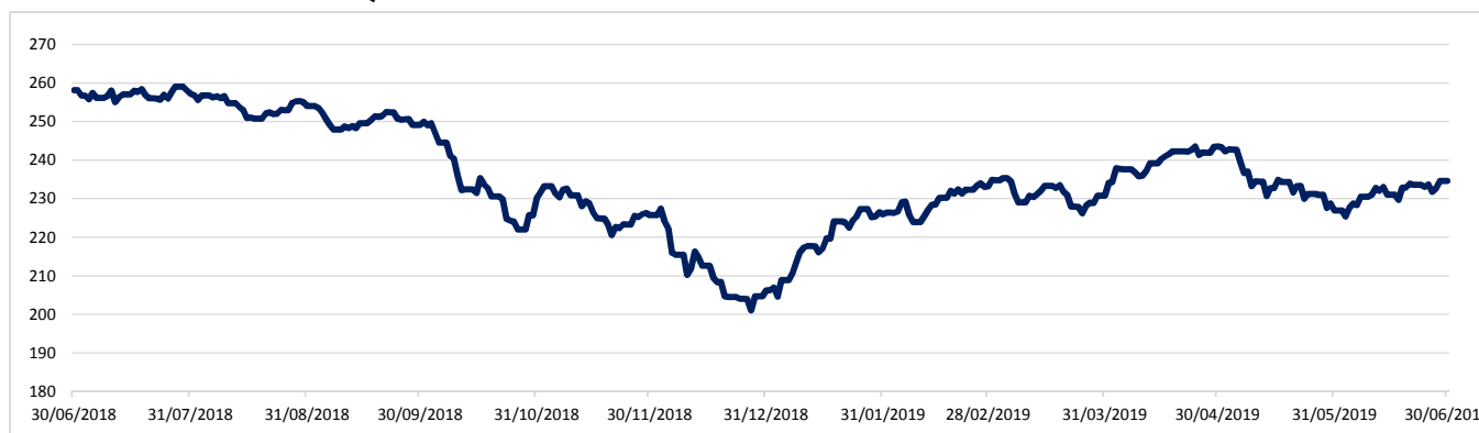
GRÁFICO EVOLUCIÓN VALOR LIQUIDATIVO MG LIERDE FP