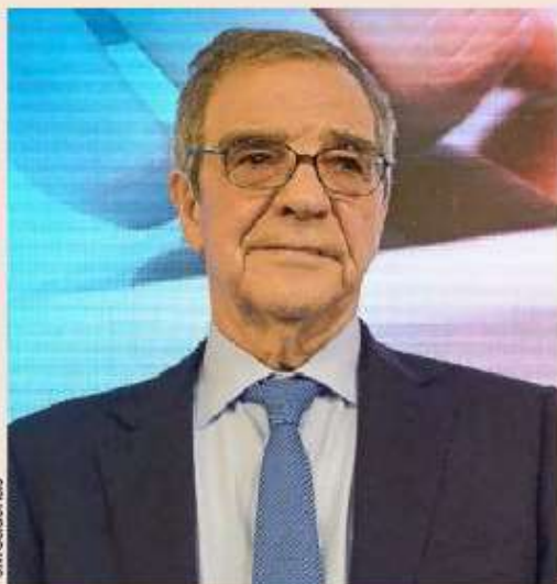
César Alierta, expresidente de Telefónica.

Estas suscripciones netas, junto a la revalorización media del 16% anual de su cartera desde el lanzamiento, permiten a la Sicav gestionada por Juan Uguet de Resayre y Carlos Val-Carreres convertirse en la quinta más grande España, con un patrimonio de